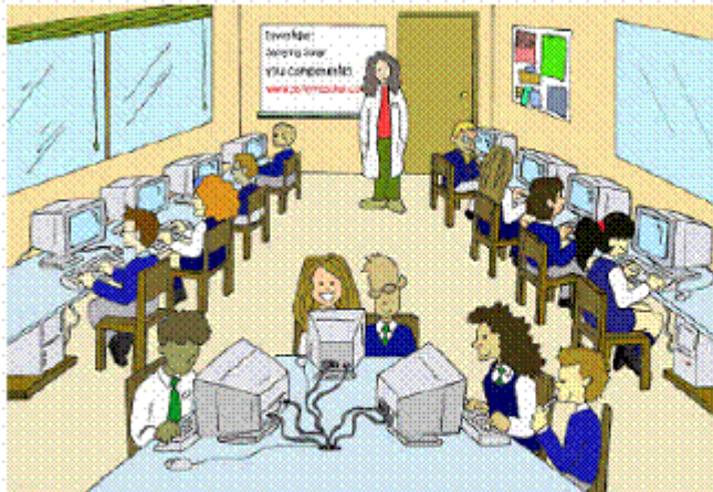
Figure 4. The computer lab

Image Chilienne tirée d'un rapport UNESCO 2005